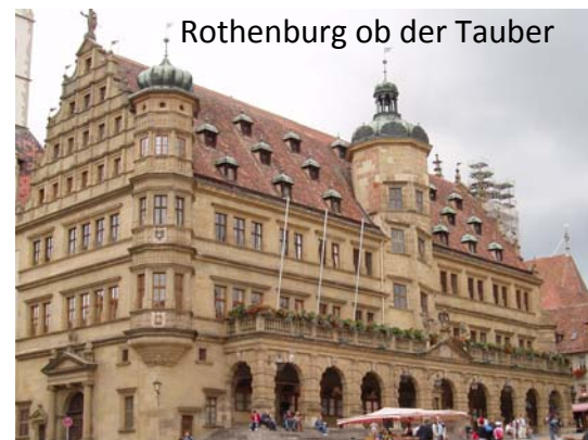
Rothenburg ob der Tauber